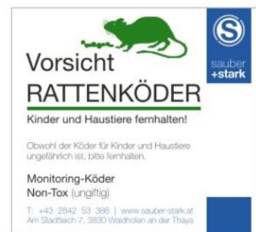
Kennzeichnung der Köderboxen