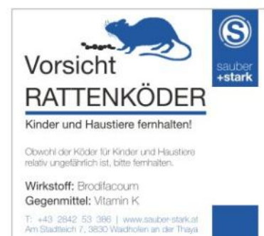
Kennzeichnung der Köderboxen

Vielen Dank für Ihr Verständnis und Ihre Mithilfe!