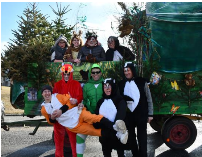
Eine besondere Freude war es uns auch die Firma Komornik mit dem Thema „Wald“ aus der Nachbargemeinde Pernegg begrüßen zu dürfen.