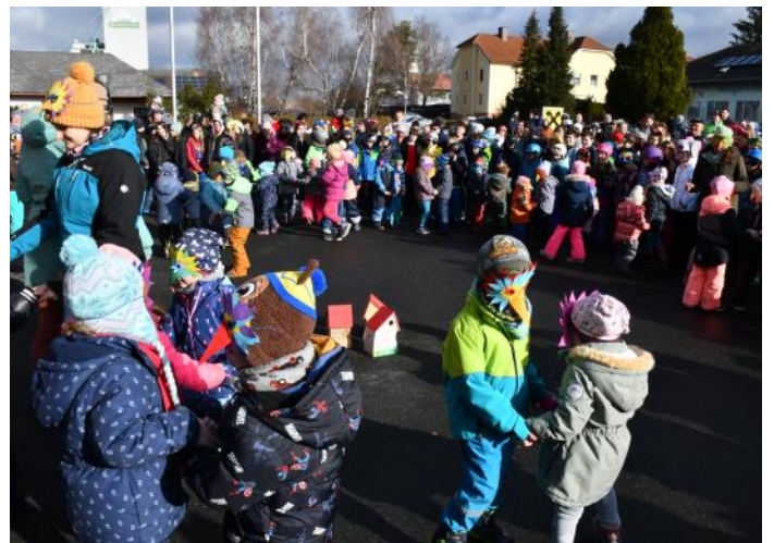
Unsere Kindergartenkinder präsentierten den „Ententanz“ und „Wenn es Luftballons regnet“