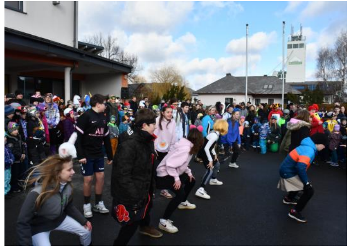
Die Schüler der 3. Klassen der Mittelschule gaben eine Showeinlage zum Lied „Sing mal wieder“