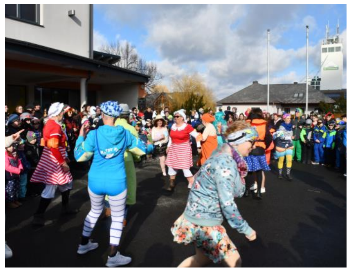
Auch die Linedancegruppe „Happy Feet“ waren - heuer mit junglichem Zuwachs - dabei und kündigten mit ihrem Beitrag bereits den nächsten Sommer an.