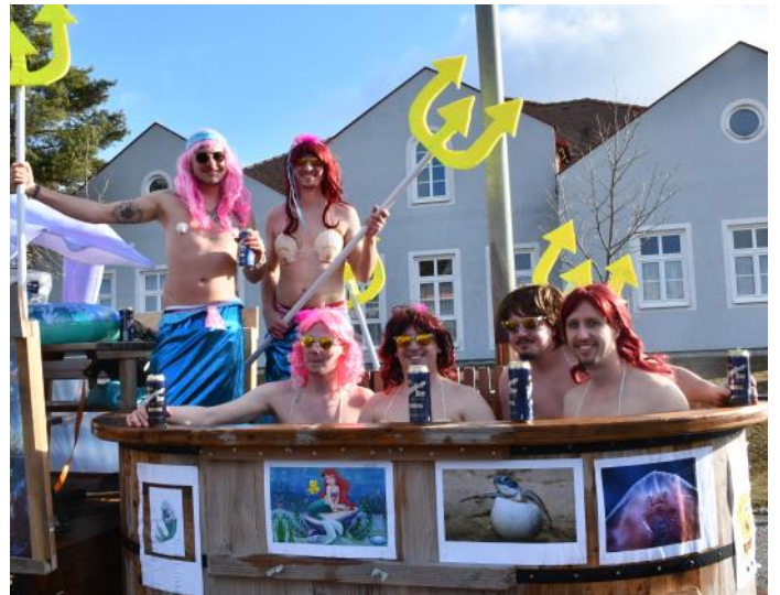
Die „jungen Grubianer“ machten wie auch schon in den letzten Jahren mit ihrem Jacuzzi als „Mee(h)rjungfrauen“ beim Umzug mit.