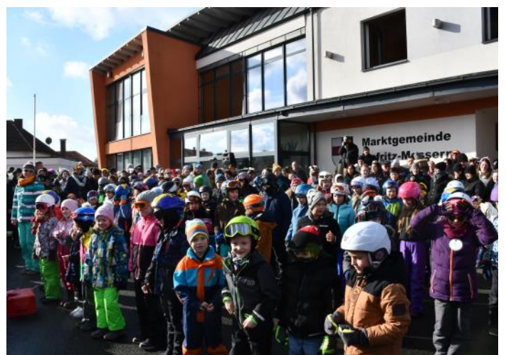
Die Kinder der Volksschule tanzten zu den Liedern „Skifoan“ und „Das Ski-Fliegerlied“